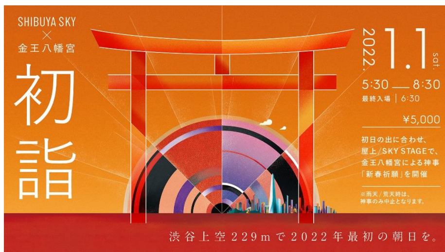
▲メインビジュアル

ご来場の皆様と新年の到来をお祝いし、新年の最初の日の出を迎える特別な時間を、ぜひSHIBUYA SKYでお過ごしください。