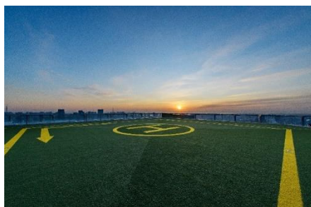
▲屋上から見る日の出イメージ